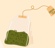
Marc de café/ sachets de thé