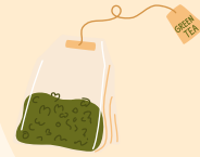
Marc de café/ sachets de thé